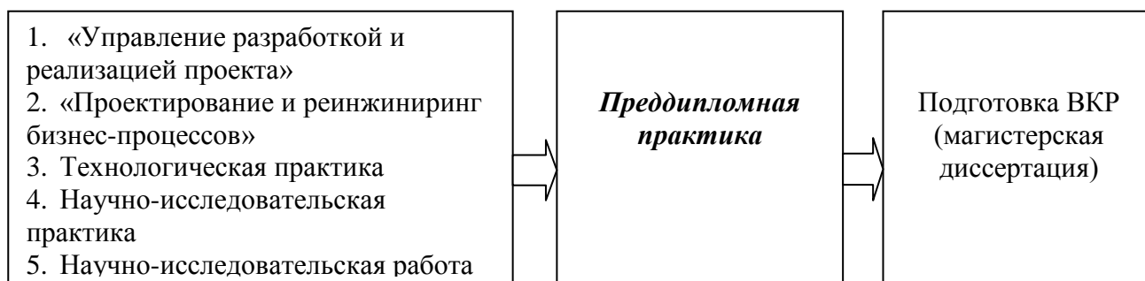
Рисунок 1 – Схема взаимосвязи преддипломной практики и других разделов учебного плана