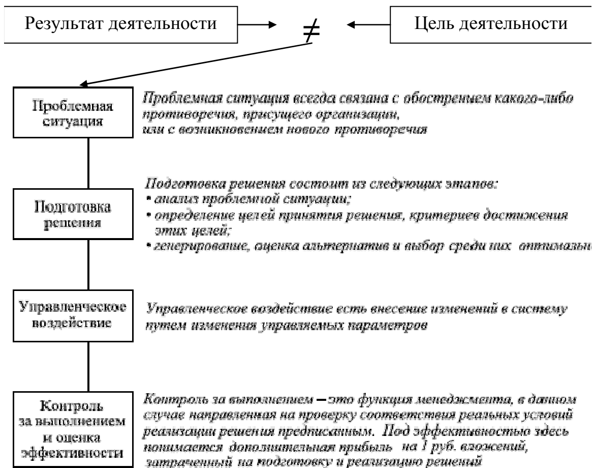
Рисунок – Алгоритм выполнения параграфа три аналитической части

Третий параграф аналитической части работы предполагает проведение узко специализированного анализа предмета исследований исходя из темы курсовой работы. Данный пункт выполняется с применением методов анализа, рекомендованных руководителем курсовой работы и предполагает описание возникшей на предприятии проблемы, ход и способы ее решения, подробную характеристику принятого на предприятии решения и оценку эффективности рассмотренного решения. В качестве основы для последовательности выполнения данного параграфа целесообразно воспользоваться алгоритмом процесса принятия управленческого решения (см. рис.).