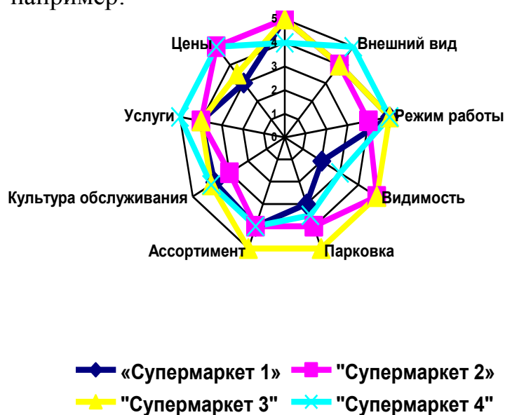
Рисунок 1 – Конкурентоспособность торговых предприятий

Полученные результаты исследования можно представить в виде диаграммы, например: