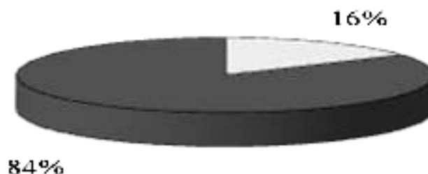
Рисунок 3 – Структура капитала предприятия, %

Иллюстрацию следует выполнять на одной странице. Если иллюстрация не помещается на одной странице, ее можно переносить на другие страницы, при этом название иллюстрации помещают на первой странице, на следующей странице указывают «Окончание рисунка (с указанием его номера)». Если иллюстрация не входит на две страницы, то на второй и последующих страницах пишут «Продолжение рисунка (с указанием его номера)», а на последней «Окончание рисунка (с указанием его номера)».