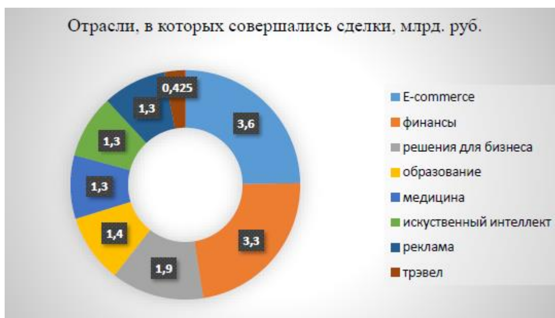
Рисунок 1 – Примеры, представления обработанной статистической отчетности в виде иллюстрировано-графического материала

Помимо, анализа статистических данных при необходимости можно выделить базовые методы управления или решения возникающих проблем при рассмотрении предмета исследования.